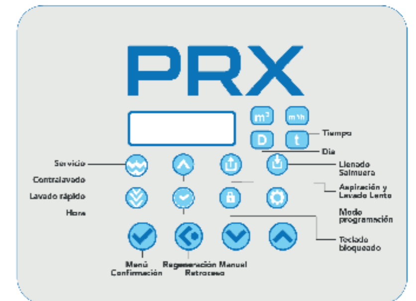
Programador digital con múltiples parámetros de funcionamiento.

Seda está diseñado para maximizar el espacio, adaptándose fácilmente a cualquier rincón disponible en el hogar.