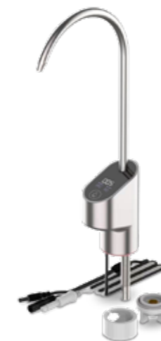
GRIFO LED HELIA